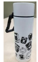
オリジナルタンブラー