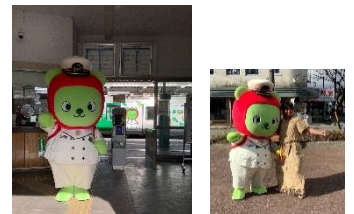
「駅長アルクマ」撮影会