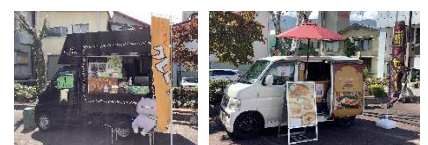
富士見駅前マルシェ