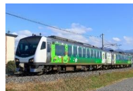
HB-E300 系リゾートビューふるさと