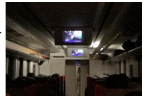
トンネル内で動画上映会

JR 社員が沿線観光地をご紹介する、「リゾートビュー諏訪湖」のために制作したオリジナルの動画です。