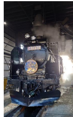
SL 検修庫内見学(イメージ)