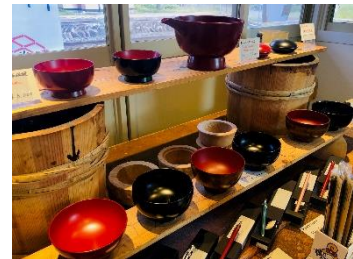
上米内駅舎内 漆関連品の展示