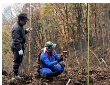
漆畑での植樹作業