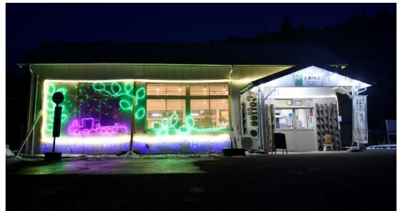
2021年度イルミネーション点灯の様子