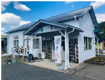
上米内駅舎外観(設置前)