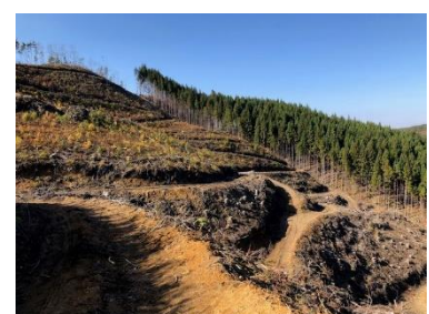
植樹作業地(上米内)