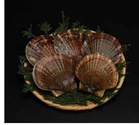
⑥陸奥湾産・活ホタテ