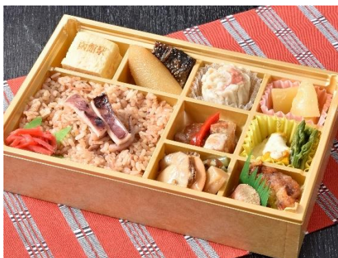
① 函館駅開業 120 周年記念弁当