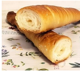
⑤リトルプリンセス・紅玉塩パン3本入り