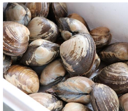
③北海道 北斗市産・活ホッキ貝