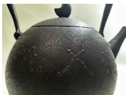
※「はくちょう座」の模様