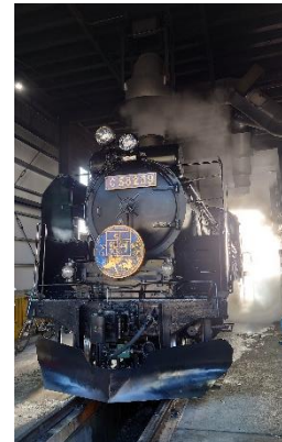
SL 検修庫内見学(イメージ)