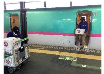
↑商品積み下ろしイメージ