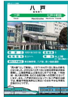
駅カードのイメージ（左：表面 右：裏面）