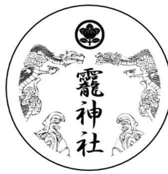
オリジナル缶バッジ（左：JR八戸駅 右：法霊山霽神社）

※ スタンプラリーで獲得するデジタルスタンプをデザインした缶バッジです（八戸市美術館除く）。