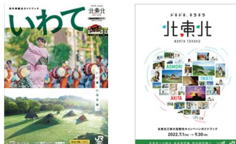
【キャンペーンガイドブック】