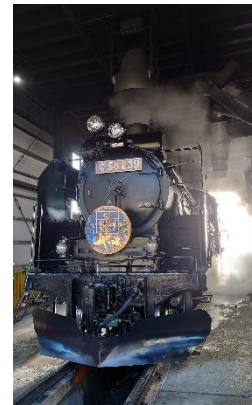
↑ SL 検修庫内見学(イメージ)