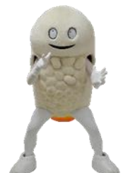
北海道北斗市 「ずーしーほっぴー」