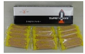
【トラピストクッキー】 (北海道)