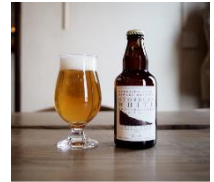
【オトビアンパールエール】

北海道乙部町のミネラルウォーター「Gaiyota」と乙部町産大麦麦芽を一部使用。琥珀色が特徴的なビール。カラメル麦芽の香ばしさとコクのあるボディ、柑橘を思わせる華やかな香りの無濾過無殺菌とは思えないクリアな喉越しが特徴のビールです。 ※6月6日(月)～6月8日(水)のみの販売