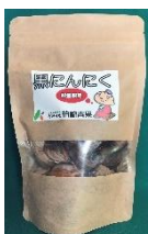
【黒にんにく 210g】 (青森県)