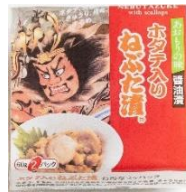
【ホタテ入りねぶた漬】 (青森県)