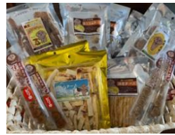
【縄文 DOHNAN プロジェクト商品】(北海道)