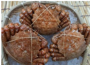
【北海道産・朝ゆで毛ガニ】

当日、朝ゆでした毛ガニを販売致します。新鮮なため、身は甘く、濃厚なカニ味噌が詰まっております。