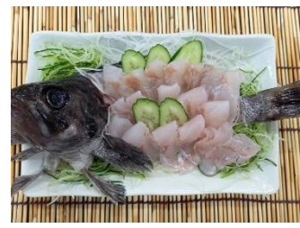
【函館産・ソイの刺身】

この時期、旬のエゾムラサキウニ。黄色くて濃厚な味が特徴的です。ミョウバン不使用。