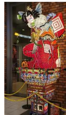
「ミニ立佞武多」がお出迎え