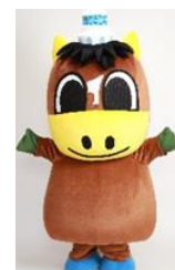
青森県東通村 「かんだちくん」