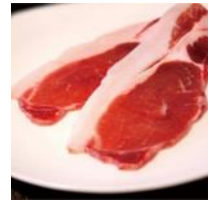
【いのしし肉・ロース】

奥津軽いのしし牧場のいのししは、大麦をたっぷり配合した100%植物性飼料と青森県産りんごを食べて育ちます。ロース肉は赤身と白身(脂身)のバランスが良い最上の部位です。