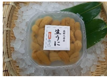
【北海道産・エゾムラサキウニ】

当日、朝ゆでした毛ガニを販売致します。新鮮なため、身は甘く、濃厚なカニ味噌が詰まっております。