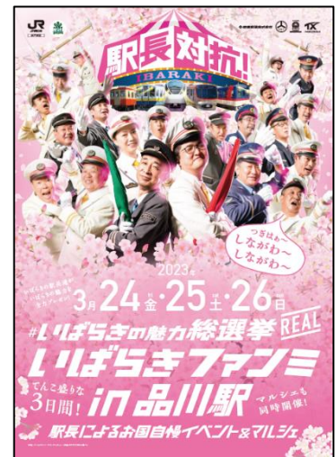
▲ポスターイメージ