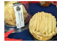
▲笠間栗モンブラン