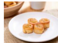
▲ぱくぱく干しいもシュトレン