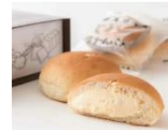
▲奥久慈卵のとろ～り クリームパン