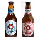
▲常陸野ネストビール