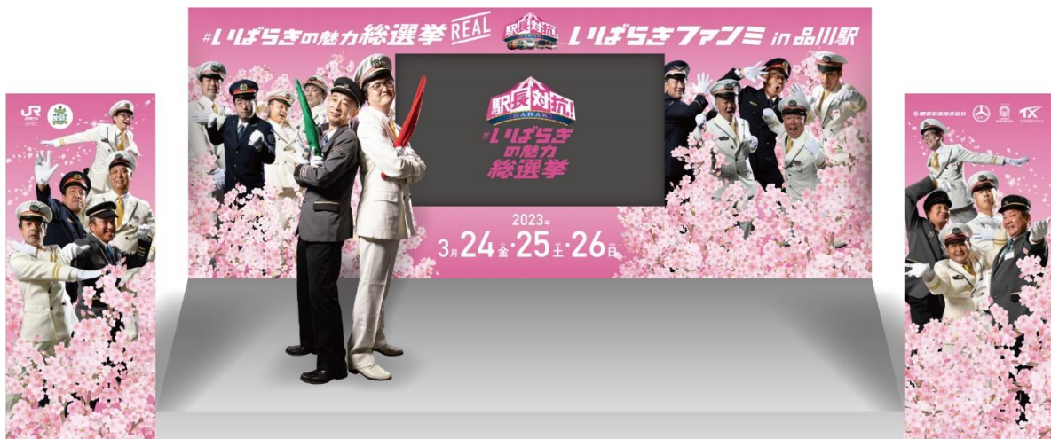
▲ステージイメージ