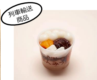
「白玉あんみつ」 (有)みはし