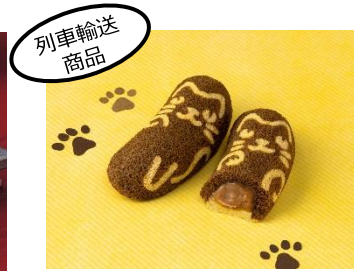
「東京ばな奈ぶにゃんこ」 (株)グレーストーン