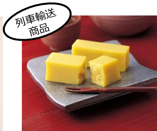
「芋ようかん」 (株)舟和本店