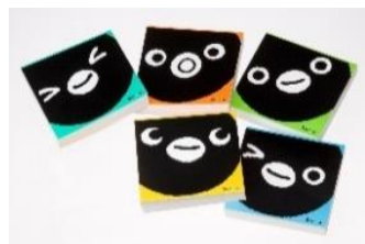
Suicaのペンギン オリジナルメモパッド