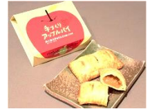
袋田食品 「手づくりアップルパイ」