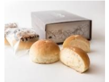
ぐるぐる 「奥久慈卵のとろ〜り クリームパン」