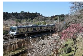
（ときわ路の景色編イメージ）