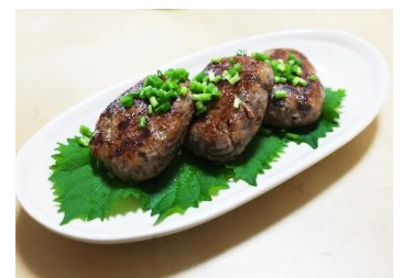
「さんまのポーポー焼き」 上野台豊商店