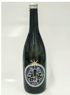
「磐城寿 貴醸泡酒」 鈴木酒造