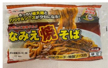
「なみえ焼そば」 旭屋