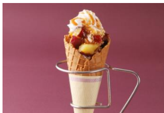
ファイブクロスティーズコーヒー(カフェ) 「茨城県産紅優甘のゼソフトクリーム」