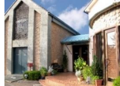
「榎グリュイエール(笠間市)」