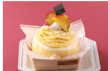
ドルチェフェリーチェ(スイーツ) 「紅はるかのモンブランロール」