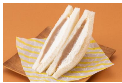
サンドイッチカフェ おいしいメルヘン。(ベーカリー) 「茨城県産栗生クリーム」