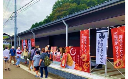
笠間栗ファクトリー(株) 敷地屋外スペース

開催日 開催中(毎週土日・祝)～12月4日(日)まで 時間 10:00～16:00 会場 笠間栗ファクトリー(株) 敷地屋外スペース