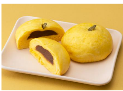
パオパオ(スイーツ) 「かぼちゃあんまん」