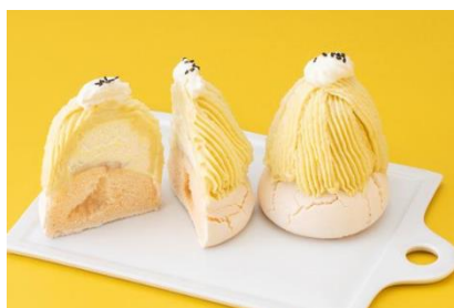
アンドメルシィ(スイーツ) 「デリース・紅はるか」

店 舗 「アンドメルシィ」「オーヴォ」「サンドイッチカフェ おいしいメルヘン。」「デイジイ」「パオパオ」