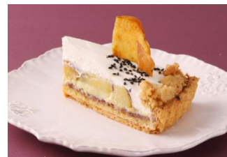
フルーツピークス アルティザン (スイーツ) 「焼き芋タルト(飯)」