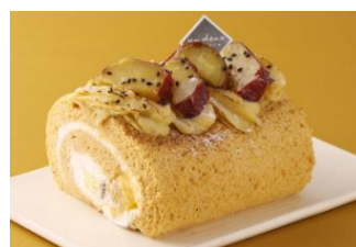
パティスリーアンドウ(スイーツ) 「焼き芋ロール(飯)」