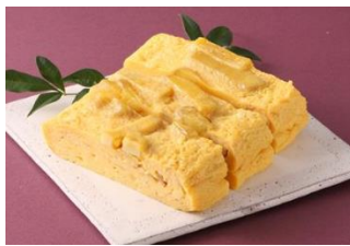
鶏と玉子 太郎(惣菜) 「干し芋の厚焼き玉子」