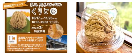
水戸駅ビル「エクセルみなみ」販売

開催日 2022年10月17日(月)～11月23日(水・祝) 時間 10:00～19:00 ※なくなり次第終了 会場 水戸駅ビル「エクセルみなみ」3階特設会場