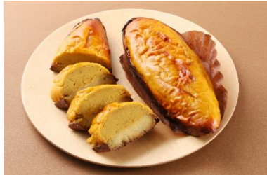
おいもさんのお店 らぼぽぼ(スイーツ) 「焼き芋まるごと大きなスイートポテト」