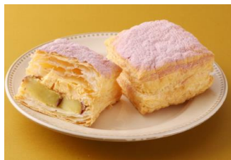
オーヴォ(スイーツ) 「たまご屋さんが本気で作った クリームパイ焼き芋ー(飯)」

店舗 「オーヴォ」「すしべん」「鶏と玉子 太郎」「パティスリーアンドウ」「ファイブクロスティーズコーヒー」「フルーツピークス アルティザン」「ルビアン」