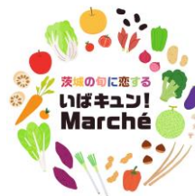
茨城県「いばキュン！ Marché」ロゴ

茨城県の県産農林水産物PR事業「 マルシェ いばキュン！ Marché」と連携し、首都圏のエキナカ・エキソで県産農産品や加工品などを販売する「産直市・マルシェ」を実施します。