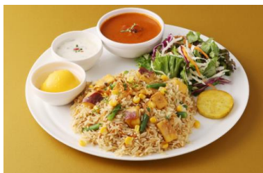
シターラ・ダイナー(飲食) 「さつまいもホクホクピリヤニセット」