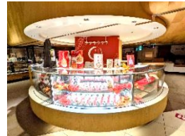
催事区画「ツツウラウラ」

開催日 9月26日(月)～10月16日(日) (開催中) 時間 月曜日～土曜日 8:00～22:00、日・祝日 8:00～20:30 会場 大宮駅「エキュート大宮」催事区画「ツツウラウラ」 販売者 (株)栗物語