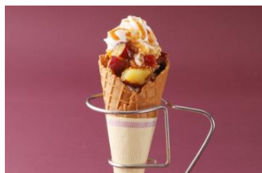
ファイブクロスティーズコーヒー(カフェ) 「茨城県産紅優甘のゼソフトクリーム」