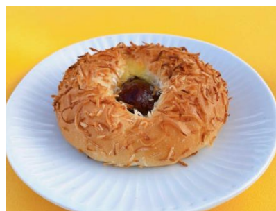
デイジイ(ベーカリー) 「パン オ マロン」