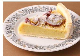
「ルビアン」(ペーカリー) 「茨城県産さつまいものタルト(飯)」