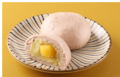
パオパオ(スイーツ) 「秋の味覚のさつまいもまん」