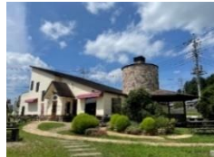
「森の石窯パン屋さん(笠間市)」