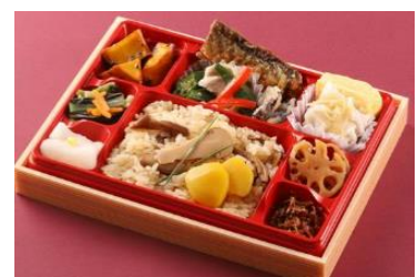
若廣(弁当) 「秋の味覚のすし弁」