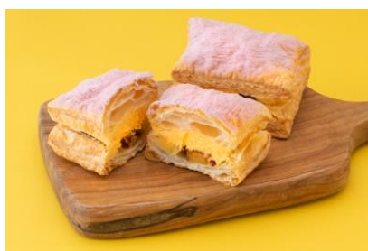
オーヴォ(スイーツ) 「たまご屋さんが本気で作ったクリームパイ・焼き芋」