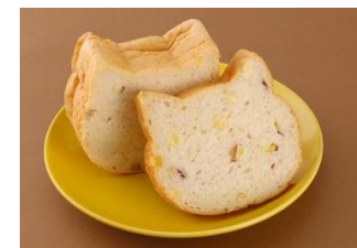
「ねこ型食パン(紫いも)(飯)」