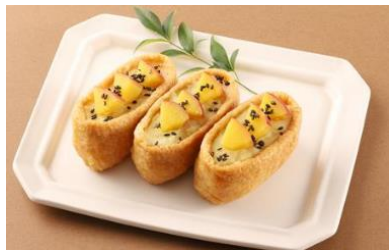
いなりすし専門店 豆狸 (弁当) 「おいものいなり」

店舗 「いなりすし専門店 豆狸」「おいもさんのお店 らぼぽぼ」「おこわ米八」「サンドイッチハウス メルヘン」「シターラ・ダイナー」「ドルチェフェリーチェ」「パオパオ」「ファイブクロスティーズコーヒー」「若廣」