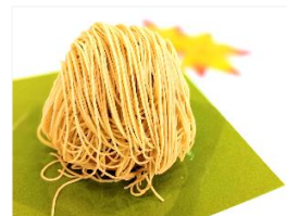
「笠間産和栗使用 絹糸モンブラン」

開催日 2022年10月18日(火)～10月31日(月) 時間 10:00～21:00 会場 大宮駅「Eki Tabi MARKET(えきたびマーケット)」イベントスペース 販売者 (株)栗物語