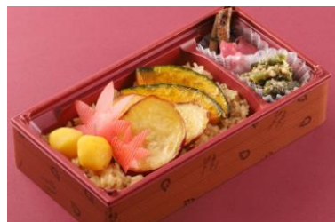
おこわ米八 (弁当) 「いも・栗・なんきん おこわ重」