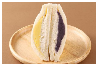
サンドイッチハウス メルヘン(ペーカリー) 「『紅はるか』と『ふくむらさき』のペアサンド」