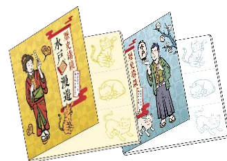
【オリジナル付箋(イメージ)】