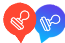
【スタンプマーク(イメージ)】