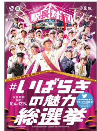
▲ポスターイメージ