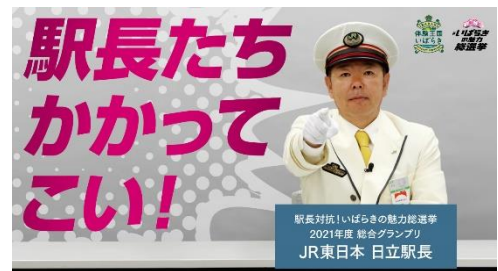
▲前回王者「日立駅長」