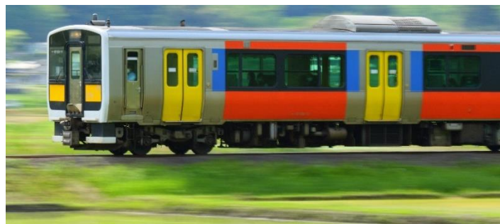
磐城塙～近津駅間を走る水郡線