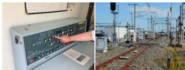
▲ポイント・信号機 取扱い体験