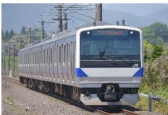
▲会場までは専用の入区車両に乗車