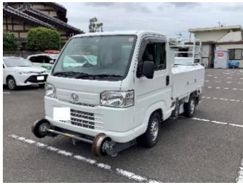
▲小型軌陸車(乗車可)