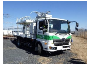
▲架線点検車(展示のみ)