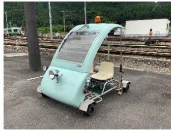
▲レールスター(乗車可)