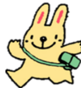
JR 東海さわやかウォーキング キャラクター ぼぼちゃん