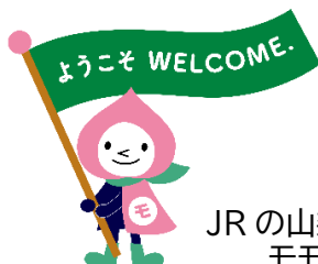
JR の山梨キャラクター モモずきん