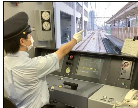
運転士シミュレータ体験