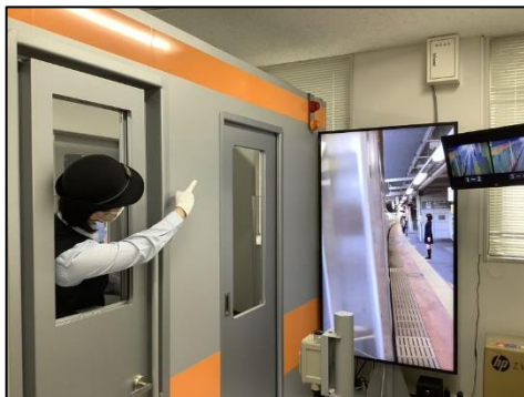
車掌シミュレータ体験