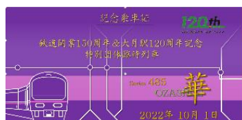
記念乗車証イメージ