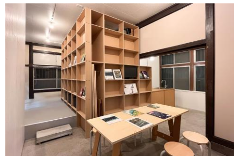
空間・家具デザイン：sna / 西原将