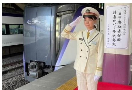
【本物の特急列車で出発式】