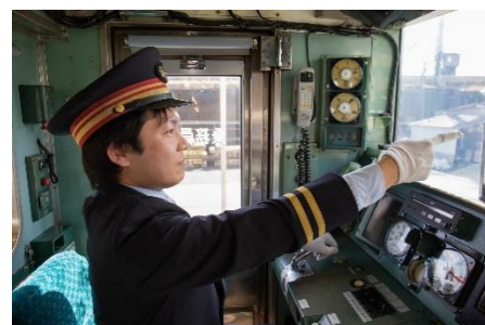
【211系運転席で記念撮影】