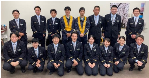
社員一同、駅長を心よりおもてなします！

■体験者に含まれるもの／昼食（駅弁）、体験中に使用する白手袋、本プラン限定鉄道グッズのお土産 ※同行者には昼食（駅弁）が含まれ、体験者と一緒にお召し上がりいただけます。