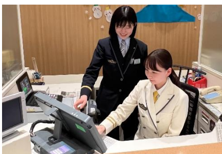
【人気の「みどりの窓口」体験】