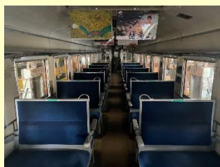
いすみ鉄道キハ28形車内

※キハ28形及びキハ40形に不具合等が発生した場合、ツアーが中止になる可能性があります。