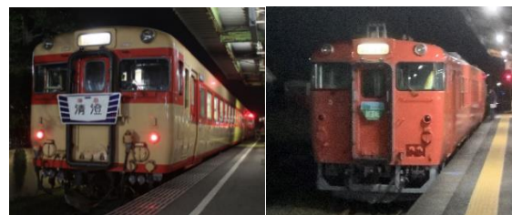
いすみ鐵道キハ28形