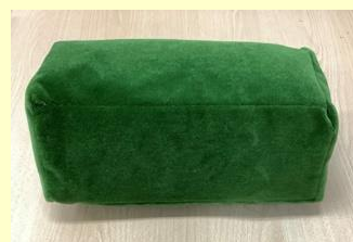
オリジナルモケット枕 ※実際のものとは色が異なります

安心してご参加いただくため、新型コロナウイルス感染拡大防止として以下の取組みを行います。