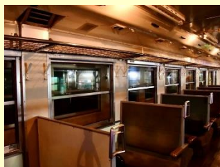
小湊鐵道キハ40形車内