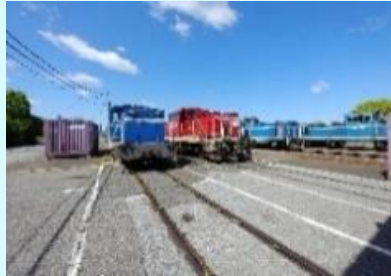
車両区（機関車基地）