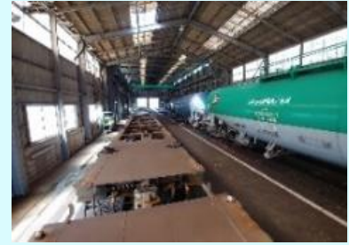
車両区貨車検修庫