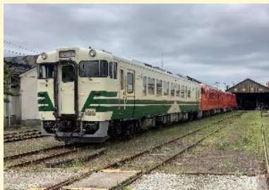
キハ 40 形