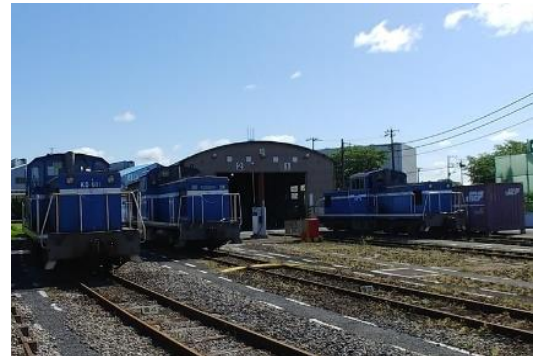
京葉臨海鉄道 KD55形式

https://www.jrview-travel.com （インターネット申込限定）