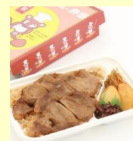
浜屋のバーベキュー弁当