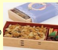
浜屋のあさりめし