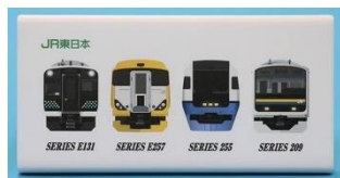
(A) 【オリジナルモバイルバッテリー】