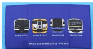
(B) 【オリジナルエコバッグ】