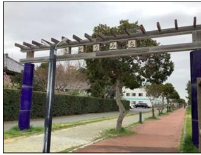
⑨九十九里鐵道廃線跡・きどうみちの門