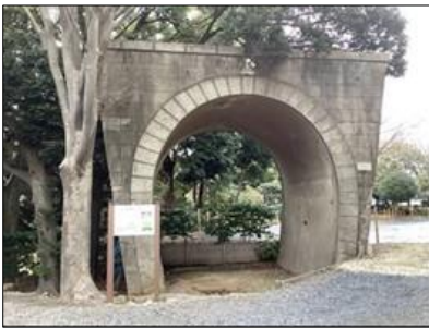
④鉄道第一聯隊演習所跡