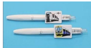
(C) 【オリジナルボールペン2種セット】