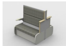
「キハ40チェア」Type40(窓側) イメージパース