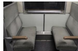
キハ40系に搭載されていた座席