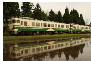
男鹿線を走行する「キハ40系」

※「キハ40系」とは…国鉄時代に開発された気動車車両で、主に非電化区間の普通列車として活躍しました。秋田・津軽エリアでは、主に男鹿線や五能線で活躍、2021年3月のダイヤ改正により普通列車から引退しています。