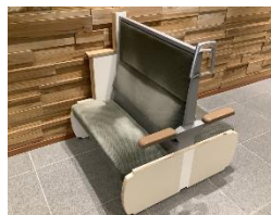
「キハ40チェア」Type40(通路側) 試作品