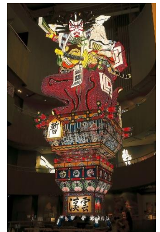
立佞武多「暫(しばらく)」