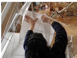
立佞武多の紙貼り体験