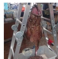
あんこう解体ショー