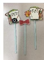
フォトプロップス

アーチやフォトプロップスを設置したフォトブースでの写真撮影をお楽しみいただけます。先着 900 名さま限定で、撮影した写真を印刷できるチエキフィルムもお渡しします。