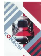
JR 東日本オリジナルグッズ