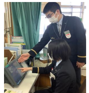
【マルス体験 (イメージ)】