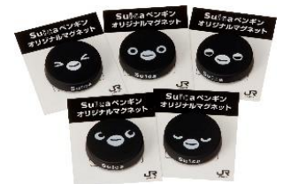
Suica のペンギンオリジナルマグネット