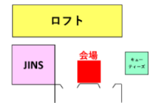
イトーヨーカドー弘前店 1階催事場（JINS 前）