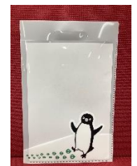
Suica のペンギン クリアファイルバッグ