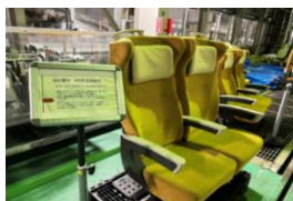
秋田新幹線「こまち」座席

【販売商品例】 秋田新幹線「こまち」25 周年記念万年筆、SL キーホルダー（真鍮製）など