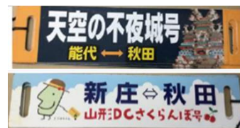
臨時列車の行先標