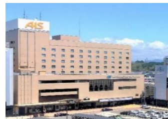
ホテルメトロポリタン秋田