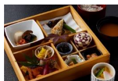
昼食/旅館平利 松花堂弁当 (イメージ)