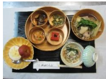
郷土料理ときりたんぼ鍋セット(イメージ)