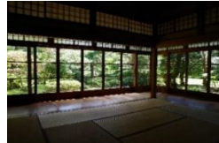
大館市立鳥潟会館(イメージ)