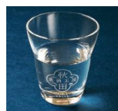
美酒王国秋田 オリジナルグラス(イメージ)