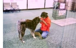
秋田犬の里(イメージ)