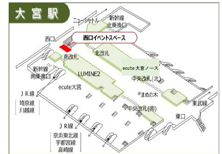
「あきた産直市」の会場位置