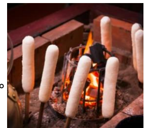
「きりたんぼ」イメージ