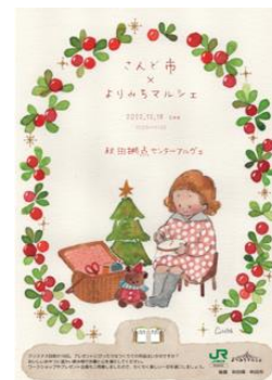
よりみちマルシェポスター