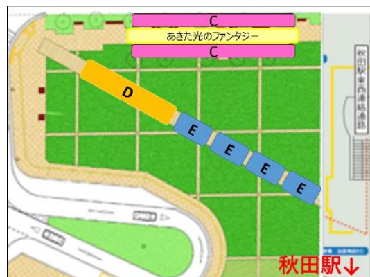
秋田駅西口駅前広場