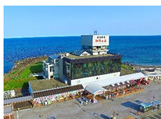
道の駅象潟「ねむの丘」温泉（イメージ）