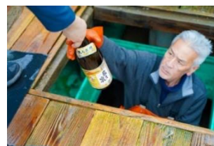
漁船酒積み下ろしイメージ

※道の駅象潟「ねむの丘」の温泉入浴には別途入浴料がかかります。(90分大人1名450円、貸タオルセット170円)