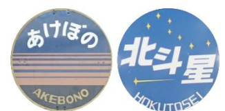
ヘッドマークイメージ