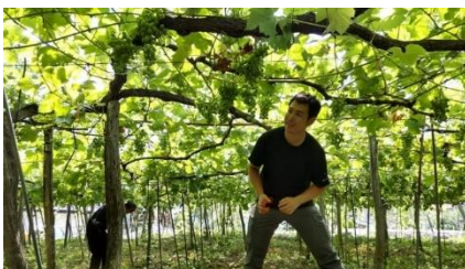
ブドウ畑(イメージ)