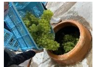
アンフォラ(イメージ)