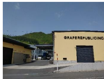
ワイナリー外観(イメージ)