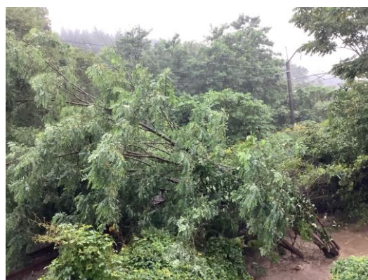
【鶴ヶ坂駅～津軽新城駅間】