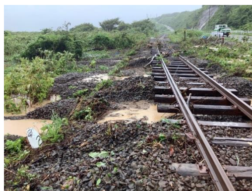
【風合瀬駅～大戸瀬駅間】