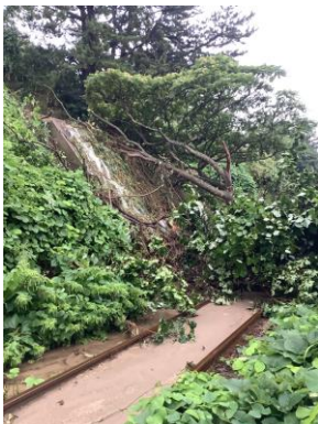
【白神岳登山口駅～松神駅間】