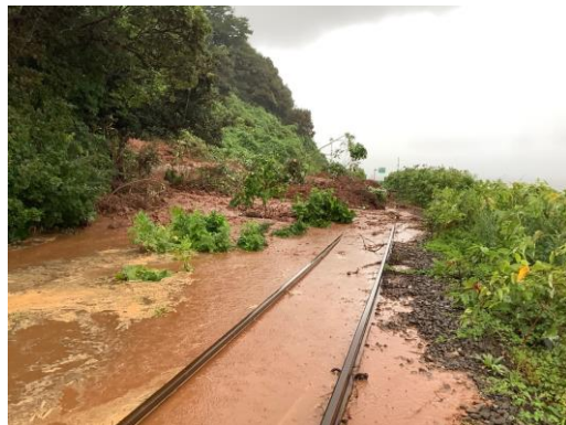
【千畳敷駅～北金ヶ沢駅間】