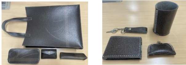
【抽選会賞品のイメージ】