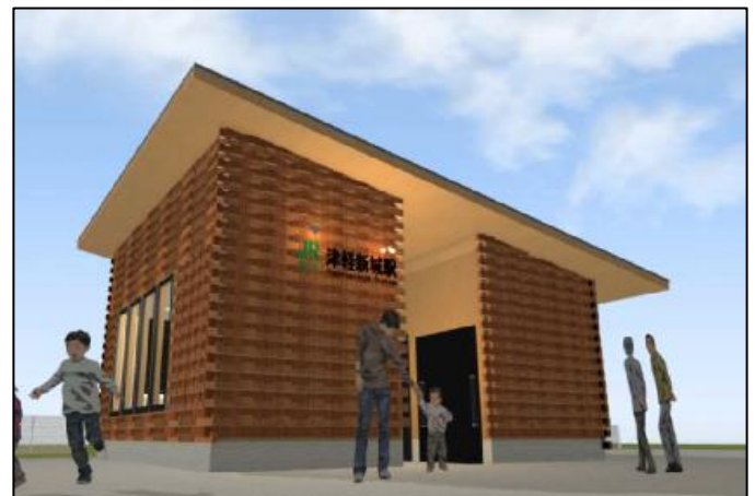
【新駅舎 完成イメージ】