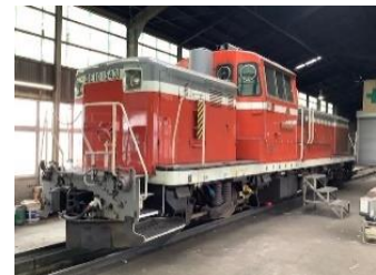
<秋田臨海鉄道所属機関車イメージ>