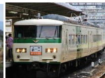
国鉄色特急列車はつかり号