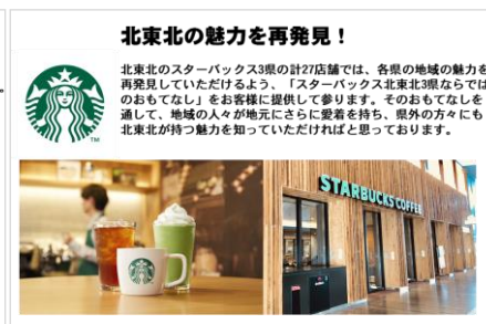
スターバックス北東北 3 県内店舗