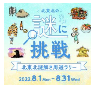
スタンプラリーweb サイト