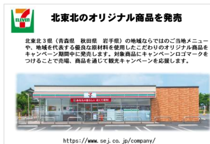
株式会社セブン・イレブン・ジャパン