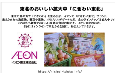
イオン東北株式会社