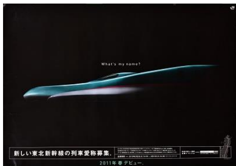
E5 系新幹線「What's my name?」