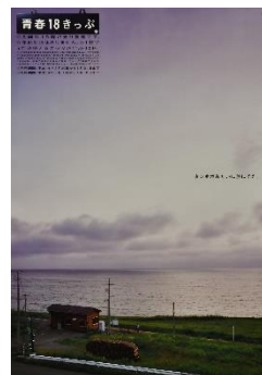
青春 18 きっぷ「五能線 虻木駅」