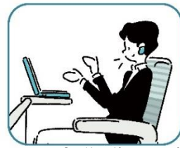
WEB 会議・動画視聴 (イヤホン着用)