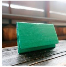
Nitta Fabrics 名刺入れ