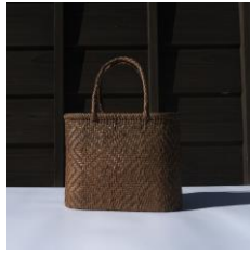
つる工房鷹山 山ぶどうカゴ