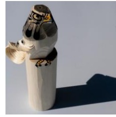
つる工房鷹山 笹野一刀 彫 おたかぼっぼ