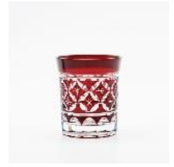
江戸切子グラス E6 系