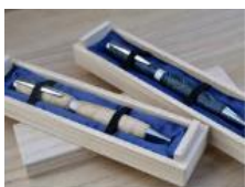
桐匠根津 ボールペン