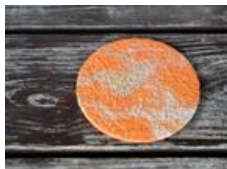
たくみの里和紙の家 コースター