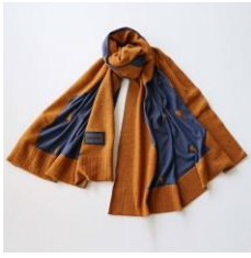
nitorito ニットストール マウンテンアンドムーン