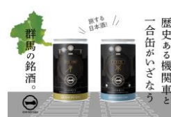
純米吟醸 JR 東日本 SL (D51)・SL (C61) 一合缶®