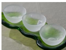
上越クリスタル硝子 まめ菜味トリオセット